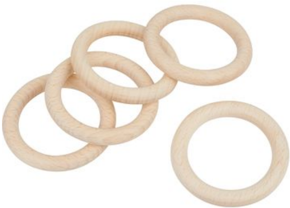
Anneaux en bois, Ø 70 mm, 5 pièces